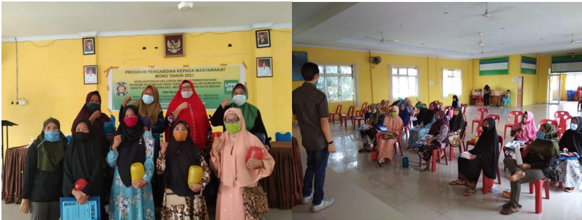
Gambar 1. Foto Pelatihan Pemasaran Digital