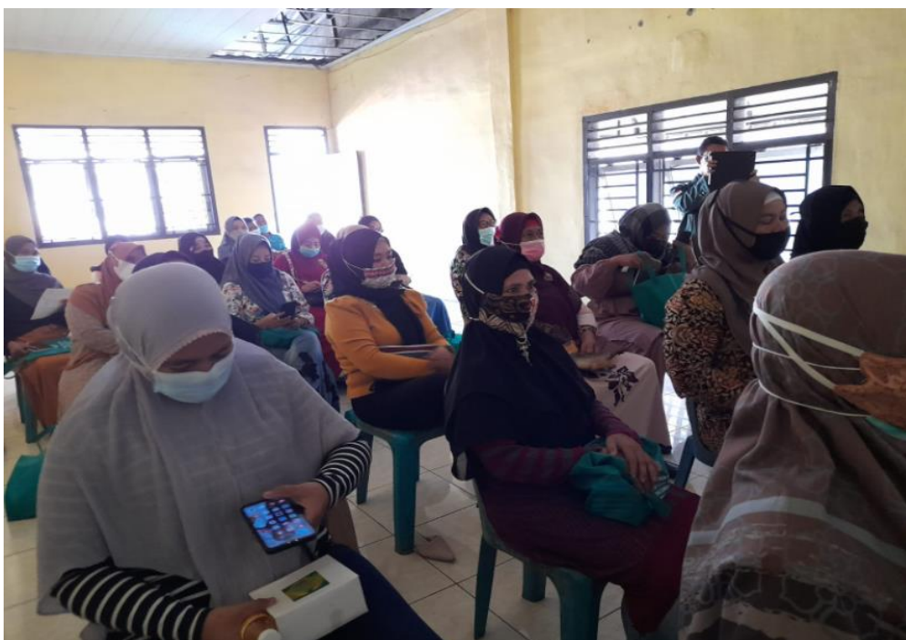
Gambar 4.5. Peserta pengabdian masyarakat Kelurahan Jati Karya Karya, Binjai Utara