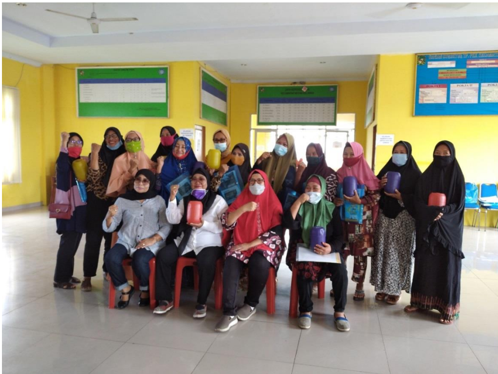
Gambar 1.1 Koperasi Harapan Wanita Pesisir Utara Medan Belawan

Adapun pengabdian masyarakat dalam Reguler Mono Tahun dilakukan di Kecamatan Medan Belawan Kota Medan yaitu para ibu rumah tangga yang tergabung kedalam Komunitas Koperasi Harapan Wanita Pesisir Utara Kecamatan Medan Belawan Kota Medan yang memiliki keanggotaan sebanyak lebih kurang 250 perempuan atau ibu rumah tangga yang berada dikecamatan Medan Belawan, Medan Deli, Medan Marelan. Koperasi Harapan Wanita Pesisir Utara Kecamatan Medan Belawan Kota Medan dijadikan mitra dalam kegiatan pengabdian ini karena seluruh anggota dari koperasi ini adalah perempuan yang masih memiliki kelemahan dalam mengelola keuangannya dengan baik, serta belum melakukan penjualan dengan online secara optimal.