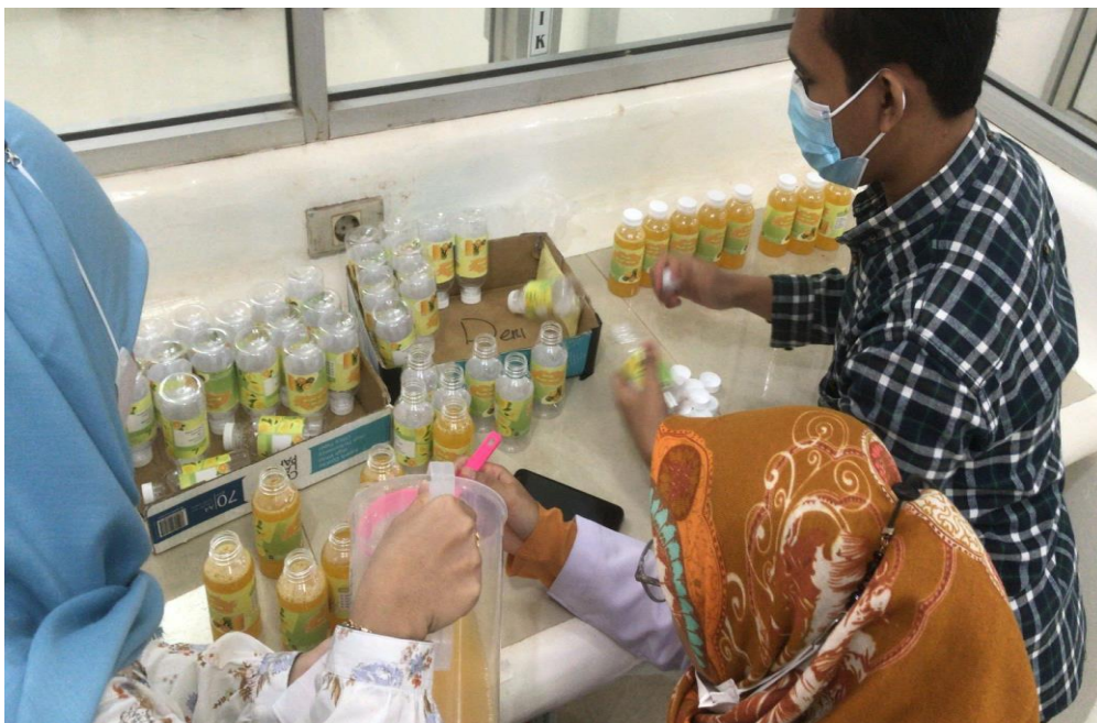
Gambar 4.1. Proses pengemasan sirup jeruk manis yang dibantu oleh mahasiswa S1 dan S3.

Selanjutnya adalah evaluasi dan penyempurnaan formula sirup buah jeruk hasil orientasi yang dilanjutkan dengan pembuatan sirup jeruk manis sesuai skala produksi yang diperlukan, kemudian dikemas ke dalam wadah. Proses pengemasan sirup jeruk yang dihasilkan dapat dilihat pada Gambar 4.1.