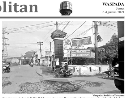
Kondisi ruas jalan di Jl. Titi Pahlawan simpang Danau Siombak yang rusak akibat truk keluar masuk dari gudang, dengan ada di kawasan tersebut.