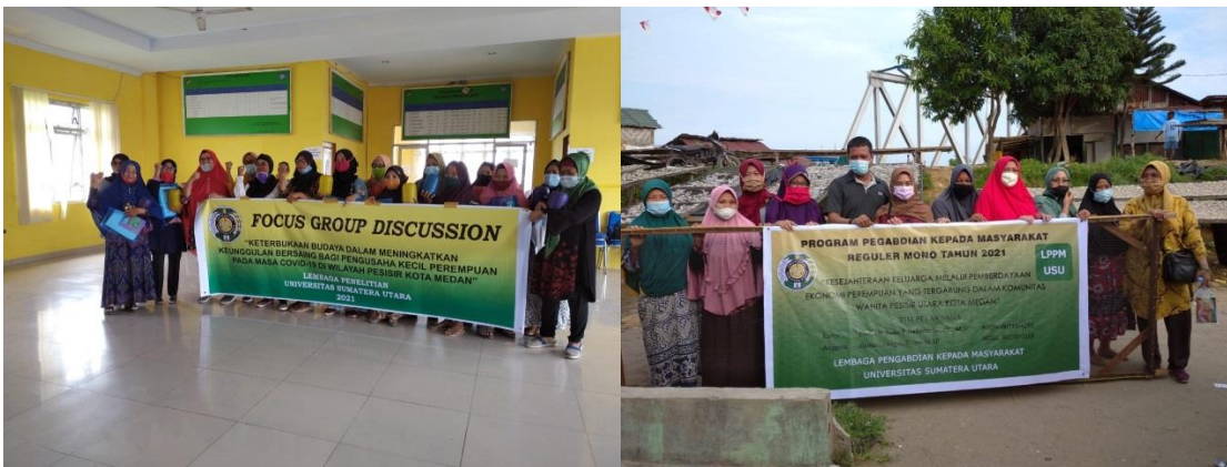
Gambar 2. Foto FGD dan Pemberian Bantuan Alat